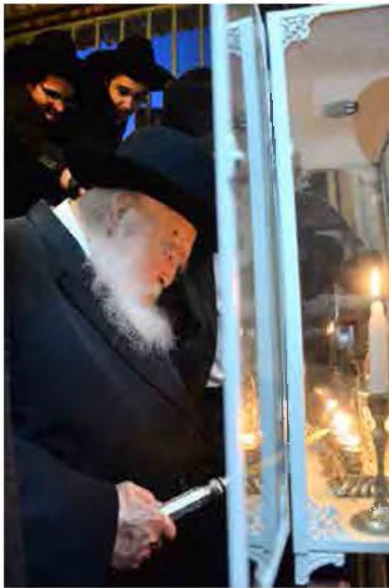
הרב זצ"ל בחולקת נרות חנוכה

ונראה קצת להוכיח דדעת המ"ב נמי דבזמנינו כאן בא"י צריך להדליק בפתח הבית מבחוץ כמו בזמן חז"ל, דהנה בשעה"צ בס"י תרע"א אות ל' דן המ"ב אם כשמדליקין בפנים בתוך הבית אך יש לו אפשרות להדליק בחלון ויראוהו בני רה"ר אך הנרות יהיו למעלה מ"ט מקרקע הבית משום שהחלון גבוה, או להדליק בפתח הבית בתוך הבית אך הנרות יהיו בתוך י"ט, וכתב השעה"צ ע"ז דלדעתו עדיף להניח בחלון הואיל ויש פרסומי ניסא לבני רה"ר, ע"ש, וכתב וז"ל ואף שהפמ"ג מפקפק קצת בזה, מ"מ אין לדחות דבר זה, דענין שצריך היכר לבני רה"ר יש מקור גדול בגמ' דאמרו עד דכליא רגלא דתרמודאי, וגם במה שאמרו מצוה להניחו על פתח ביתו מבחוץ וכו' עכ"ל ע"ש, והנה השעה"צ איירי בזמנו בחו"ל שהדליקו בתוך הבית וע"ז הוא מוכיח מהגמ' שדיברה על עיקר התקנה לא בזמן הסכנה, ולכאורה מאי רא"י היא זו י"ל דאחרי שהיה שעת הסכנה ונוהגין להדליק בפנים שוב אין ענין בפרסומי ניסא לבני רה"ר וסגי בפרסומי ניסא של בני הבית, על כרחך דס"ל להמ"ב דגם אחרי שתקנו בשעת סכנה שסגי להדליק על שולחנו, לא עקרו את עיקר התקנה, וברגע שיוכלו להדליק על פתח הבית מבחוץ ולפרסם הנס לבני רה"ר יחזרו לעיקר התקנה.