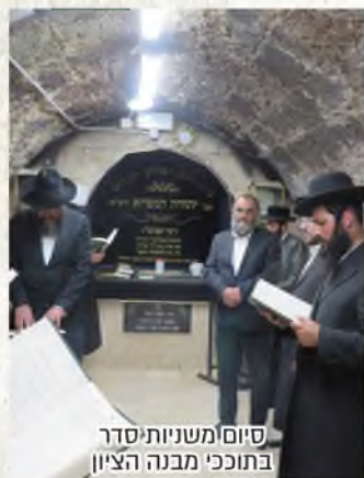
סיום משניות סדר בתוככי מבנה הציון