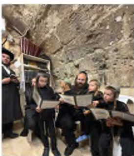
לומדים את הדף היומי' במשניות של יום ההילולא שהודפס במיוחד