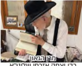
מרן הגאון רבי יצחק אורחי שליט"א