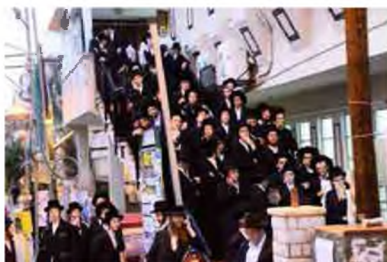
פירסומא ניסא - המנונים עומדים במדרגות ביהמ"ס לדומן לראות את הרב זצ"ל מדליק נרות חנוכה

בפעם אחרת אמר לי מו"ר (שליט"א) [זצוק"ל] לפי מה שפסק מרן זצוק"ל שמרפסת דינה כחצר אף בזה"ז (חזו"א יו"ד ס' קס"ח ס"ק ז), א"כ יכול להדליק על המעקה של המרפסת הפונה לרה"ר, ובשלש עובדות הורה כן מו"ר למעשה, לבחור בישיבת בית מאיר, לנכדו שיח' שגר עם מו"ר והדליק על המעקה של המרפסת ולא בפתח החדר שיצא למרפסת (בדירתם שהיתה צמודה לדירת מו"ר) אמו בתו של מו"ר הדליקה בצד השני בפתח פרוזדור הדירה הפונה לרחבת היציאה (כדלעיל) וכן לנכדי שיח' שהדליק על המעקה של המרפסת, אני הדלקתי בפתח היוצא למרפסת ונכדי על המעקה.