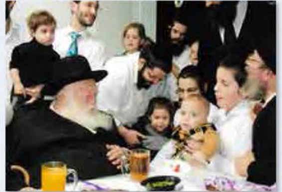
בחולות דמי חטאת אצל חתנו הגר"י קולצקי שליט"א

וחדר חשיב כדירה בפנ"ע ואנו דנים אותם כדירות חלוקים, נשאל מו"ר צ"ל במי שהתחיל לאכול בחדר זה אם יכול לצאת לחדר אחר, אם יש לחוש בזה משום שינוי מקום המבואר בס"ק ע"ח, והשיב בזה"ל שינוי מקום הוא רק כשיצא תחת אויר השמים עכ"ד.