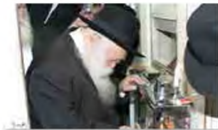
רשכבה"ג מרן שר התורה צוק"ל בהדלקת נחת חנוכה

באופן מיוחד, וכדי לדרבן את הלומדים, בין העונים בהצלחה על המבחן היומי בשלמסר של 'שיח התורה' או ב'נדרים פלוס, מתקיימת בכל יום מימי החנוכה הגרלה על חנוכייה מפוארת מבית 'האחים-חדד', לתועלת הלומדים: הודפסה חוברת מיוחדת עם סדר הלימוד הלכות חנוכה ב'שונה הלכות', כשניתן להשיג בכניסה לבית מרן זיע"א, בבתי הכנסיות, ובמשרדי מכון 'שיח אמונה' רחוב חפץ חיים 7 בני ברק, או בדוא"ל במשרדי המכון se3077700@gmail.com