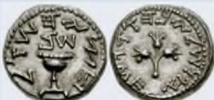
חצי שקל משני צידיו מימות 'המור הדגול' ברומאים בארץ ישראל – בצד אחד מופיע הכיתוב 'ירושלים הקדושה'

שנינו במשנה: 'באחד באדר משמיעין על השקלים ועל הכלאים', וביאר מרנא ה'חתם סופר' (הובא בספר 'תורת בר נש', ח"ב עמ' קל"ט) כי מטרת 'מחצית השקל' היא אחדות גמורה בכלל ישראל – 'העשיר לא ירבה והדל לא ימעט' אלא כולם יתנו בשווה, וזה בא להורות לאדם כי בלי התחברות עם הכלל, הרי האדם נחשב רק 'מחצית', ולא תושג השלימות בלא האחדות, אך היה מקום לטעות ולומר, שמכיון שכך ילך האדם ויתחבר גם לרשעים, לכן מיד נאמר במשנה: 'ועל הכלאים' – לומר לאדם כי כמו שאסרה התורה התחברות והזדווגות של שני מינים זרועותם יחד באדמה – כמו כן ישמור על האדם על עצמו שלא להתחבר עם מי שאינו מינו – כמו הרשעים.