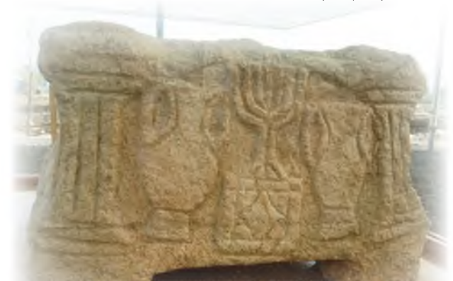
חריטה של מנהרה ופך שמן משרידי בית הכנסת מימות בית שני במגדלא ליד חוף הכנרת

לסיום , יש לציין כי דעת ה'גר"א' – כפי שמסר רבי אברהם זצוק"ל, בנו (בהקדמה לספרו 'רב פעלים') – שבזמן חז"ל היה מסכת קטנה (הכוללת בתוכה ברייתות) ושמה ' מסכת חנוכה ', והיא אחת מן המסכתות הקטנות שנאבדה מעמנו, יהי רצון ויתגלה אור תורה שבע"פ בקרוב, אמן!