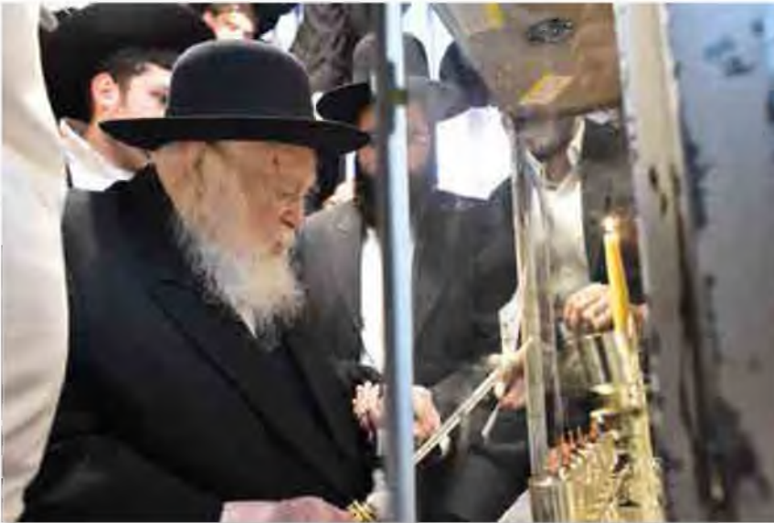
הרב זצוקל בהצלקת נרות חנוכה

הנרות הוא לשם מצוות חנוכה, כי הרי היכר אחר א"א לעשות דהא רק על שולחנו הגויים מניחים לו להדליק, אבל במקום אחר כגון כשמדליק על פתח הבית מבחוץ או בחלון שהוא יכול לעשות היכר אחר לא סגי בהיכר הזה שמניח עוד נר, דהנה באמת אי"ז כ"כ היכר דהנה באמת יש להבין מהו ההיכר כאן דאין לומר דהיכר הוא שיש כאן שתי נרות, ואם היה מדליק לאורה הוה סגי ליה בנר אחד, ואם הדליק שתי נרות ניכר שאחד לשם מצוה, ליכא למימר הכי דהתינח ביום ראשון, אבל בלילה השניה של חנוכה למה