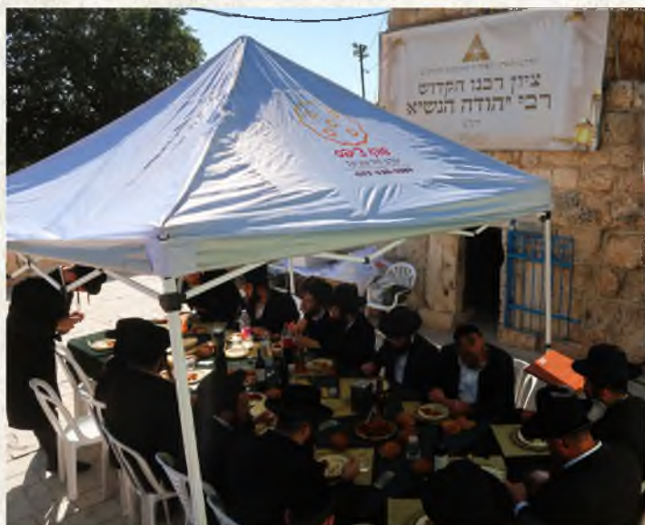
"עשינו ברחבה שמחוץ לציון" סיום סדר ב'דף היומי משניות' ע"י אברכי הכולל מחוץ לציון

קשה לתאר את ההרגשה של ללמוד משניות בעיון אצל רבי יהודה הנשיא זת"ע מרגישים סייעתא דשמיא כאילו בעל השמועה עומד מולנו