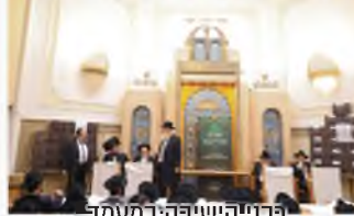
רבני הישיבה במעמד