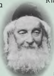
הנצי”ב מוולאז”ן – בעל ‘מחומי שדה’

ומכאן למד הנצי”ב לנידון אחר בהלכות שבת: כיידוע ‘גרף של רעי’ – כל דבר המדיף ריח כגון כלי מאוס או לכלוך וכדומה, על אף שהוא מוקצה מותר טלטלו בשבת, וזו תקנת חז”ל (ביצה ל”ו ב’) משום כבוד הבריות (ראה רש”י שם ד”ה נותן, ובלבוש סי’ ש”ח סעי’ ל”ה), והיה מקום לדון באופן שאדם רוצה לטלטל מוקצה בכדי לכסות את הגרף של רעי, או בכדי להזיזו ממקומו – האם מותר או אסור? הסברא הפשוטה נוטה לומר שאכן מותר, והדברים קל וחומר: אם את גוף ה’מוקצה’ התירו חז”ל לטלטל, כל שכן לטלטל מוקצה עבור סילוקו יהא מותר, אלא שממשנתנו מוכח שאף שטלטול השרץ הותר בגלל ש’אין שבות במקדש’ לא הותר טלטול מוקצה אחר בשביל סילוק השרץ, וזה לשונו של הנצי”ב: ‘שרץ שנמצא במקדש כהן מוציאו בהמיינו. והיינו בשבת כפירש”י ז”ל דאילו בחול אפשר להוציאו בבול עץ, אבל בשבת אסור משום מוקצה, ומכאן יש ללמוד דאע”ג שהתירו גרף של רעי אפילו להוציאו בעצמו, מכ”מ [= מכל מקום] בגזרי עצים אסור’.