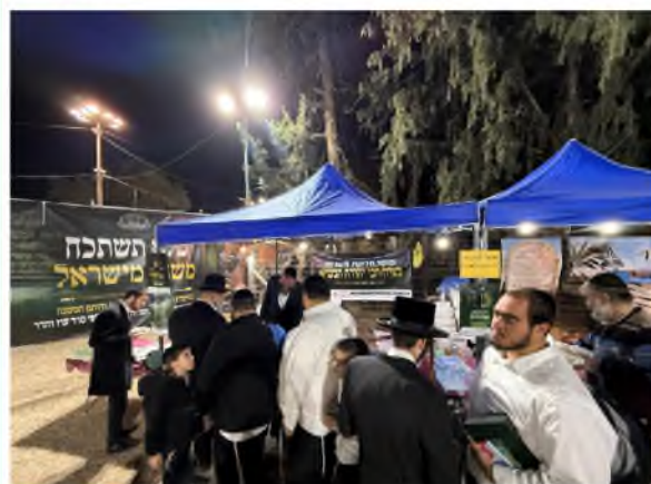
דוכן דף היומי במשניות ביום ההילולא