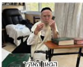
הגאון האדיר רבי מיכל זילבר שליט"א