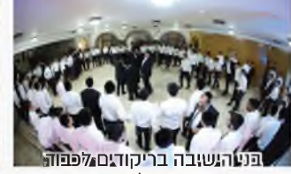
פנייה הישיבה בריקודים לפפדה גומרה של תורה

מדברי מרנן ורבנן גדולי התורה שליט"א ממעילת לימוד דף היומי משניות