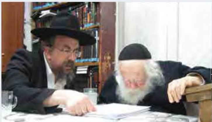
הגר"מ מקלב שליט"א במ"מ תורני עם הרב זצוק"ל

שוב שאלתי באופן הנ"ל כשמונה שם [בהול הנ"ל] ספה או שולחן ופעמים שאוכלים שם ויושבים ומדברים שם אם בכה"ג משוינן ליה כחצר שבזמן חז"ל