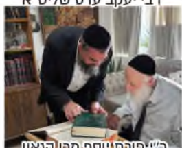
ר"י פורת יוסף מרן הגאון רבי שמואל בצלאל שליט"א