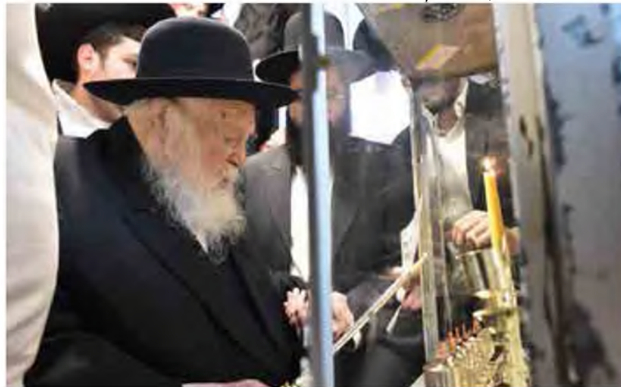
הרב זצוק"ל בהדלקת נרות חנוכה.