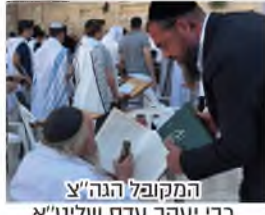
המקובל הגה"צ רבי יעקב עדס שליט"א