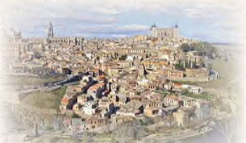
העיר 'טולדו' מקום מגוריו של רבינו הרא"ש.