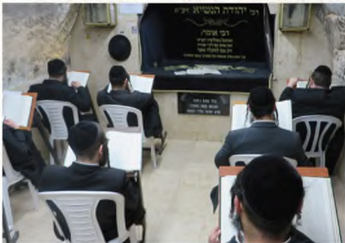
אברכי כולל 'מוסדות רבי יהודה הנשיא בציפורי' שוקדים על לימוד המשניות בתוככי הציון