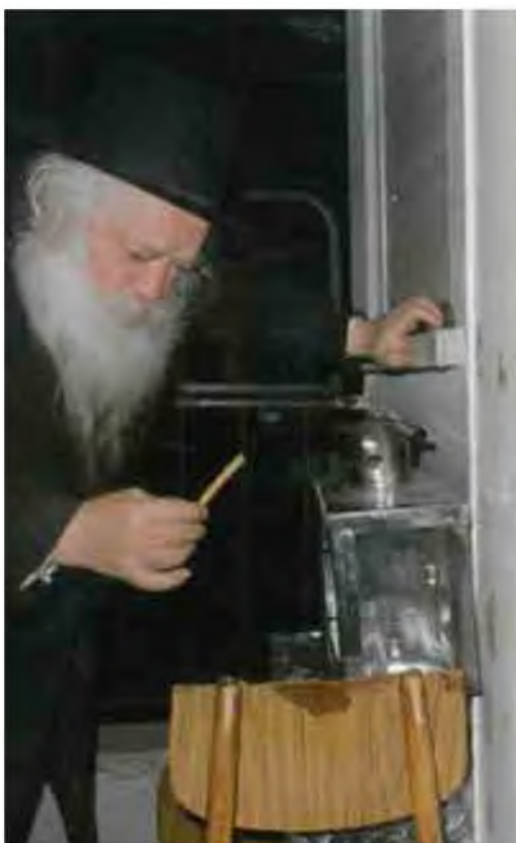
הרב זצ"ל בהדלקת נרות חנוכה במוצ"ש לפני כעשרים שנה

(ד) אולם מה שיש להסתפק, בזמן של הרמ"א שמדליקים בפנים לגמרי (לא