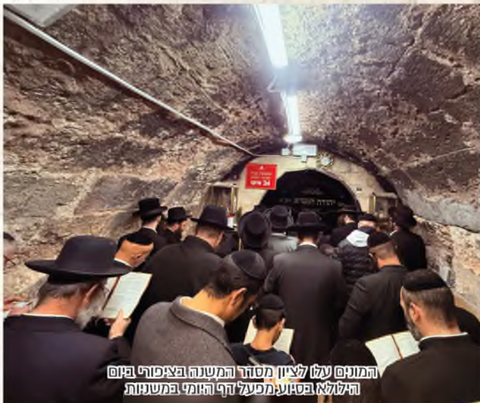
המונים עלו לציון מסדר המשנה בציפורי ביזם הילולא פסאע, מפעל ה'דף היומי במשניות'

שאתל של המפעל ללמוד 'דף היומי משניות', עמד בפני הצבור ואפשרו את הנסיעה אל הציון. ההרגשה היא שהחיבור של לימוד המשניות בסדר ה'דף היומי' - חידש וחזק את הקשר אל רבנו הקדוש על ידי רבבות הלומדים, והשירות של ההסעה הוא ביטוי לאותו צינור של קשר יומי, שנחשפנו לקיומו בשיחה מיוחדת זו.