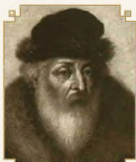
מתנא והבנא דפי עקיבא אייגור זיע”א