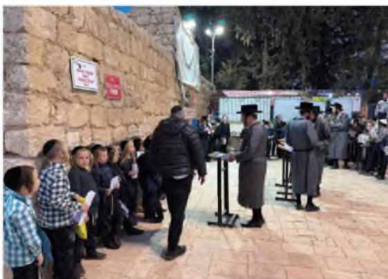
עשרות ילדי ת"ת תוא"י מהר יונה בסיום המשניות בציון