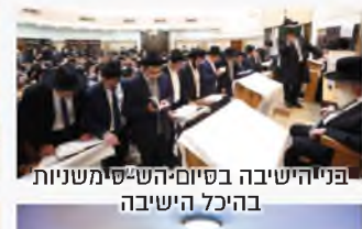
פנייה ישיבה בסיום הש"ס משניות בהיכל הישיבה