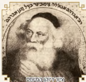
ציוה דיוקן המנוח לבעל ‘מגן אברהם’

שאכן הרמב”ם סבר שאף לפי חכמים שאין מצות שריפה בדוקא, עכ”פ כיון שבביעור חמץ מקיימים מצוה של ‘תשביתו’, ממילא זה סיבה שאכן האפר יהא מותר אפילו לדעת חכמים, וזאת ע”פ דברי התוס’ בתמורה (ל”ג ב’ ד”ה הנשרפין) שכתבו שהטעם שהנשרפין אפרן מותר הוא בגלל ש’נעשית מצותן’, וממילא – אומר רעק”א – גם לפי חכמים שאין מצוה בדוקא לשרוף, עכ”פ אם שרף בודאי קיים מצוה של ‘תשביתו’, ואכן האפר יהא מותר, לכן לא חשש הרמב”ם שישתמשו באפר, כמובן שלהבנה זו הרמב”ם חלק על הטור שכתב שרק לפי ר”י ש’אין ביעור חמץ אלא שריפה’ – האפר יהא מותר, אבל לחכמים האפר אסור, ובהבנת דברי הטור שלא סבר כן – ראה בתוס’ חדשים על משנתנו בשם הרה”ק בעל ‘קדושת לוי’ זיע”א, ובשו”ת אבני מילואים סי’ י”ט, ובחיידושי הגר”ח הלוי על הרמב”ם שם, כמו כן מרחיב על יסוד מחלוקת ר”י וחכמים בעל ה’מנחת חינוך’ בספרו במצוה ט’.